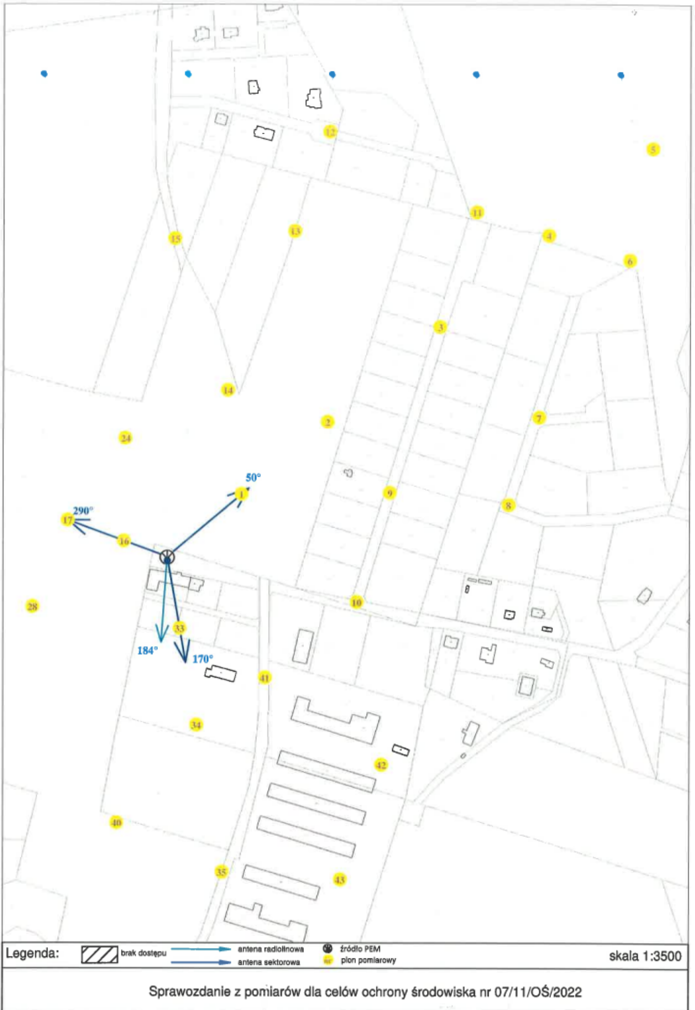
Rys. 2 Lokalizacja pionów pomiarowych