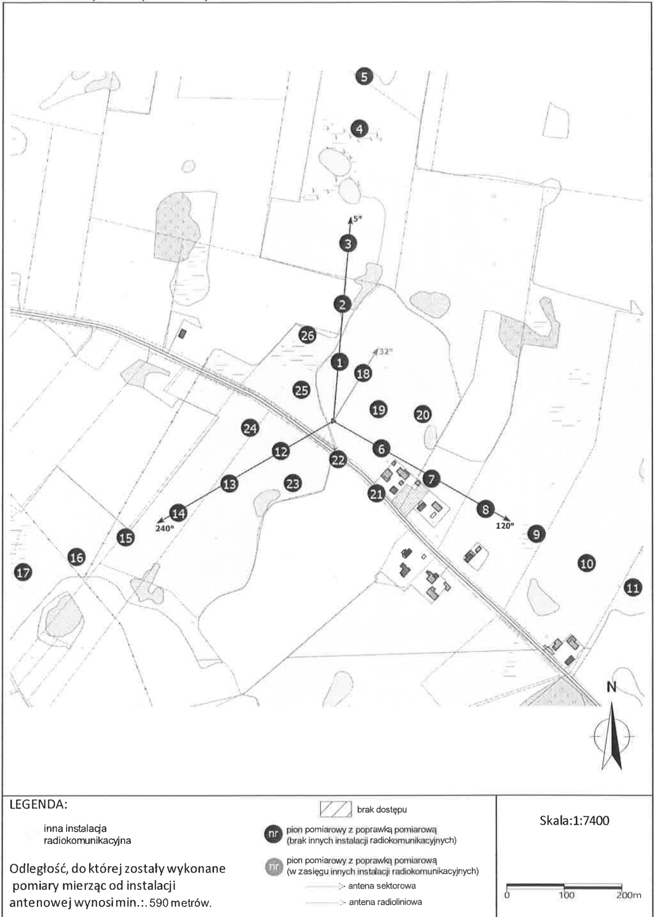
Załącznik 2. Widok pionów pomiarowych

„Bez pisemnej zgody Laboratorium niniejsze sprawozdanie nie może być powielane inaczej, jak tylko w całości. Ponadto wyniki dotyczą tylko badanych obiektów przywołanych w niniejszym sprawozdaniu z badań”